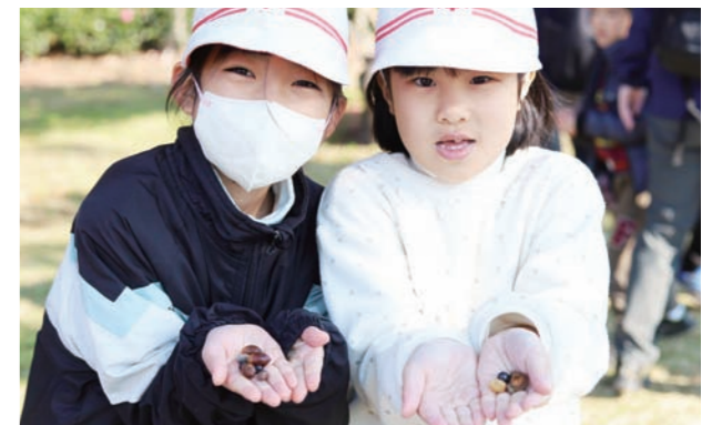
自然の不思議や大切さを学び、秋の終わりと春の訪れを発見

森林散策を通して自然の役割を知ってもらおうと「自然体験活動」(中央児童館主催)が12月25日(月)、町運動公園で開かれました。活動は(公社)宮崎県緑化推進機構の事業を活用し実施。この日は同館を利用する児童など約30人が参加し、講師の指導のもと、木の葉の揺れる音や風の音に耳をすましたり、木の実や花のつぼみを見つけるため、林の中を探索したりしました。