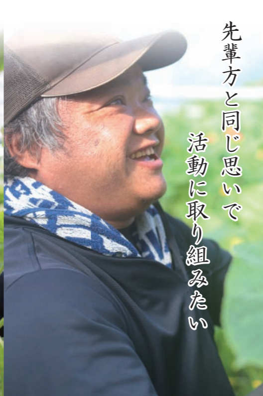
先輩方と同じ思いで