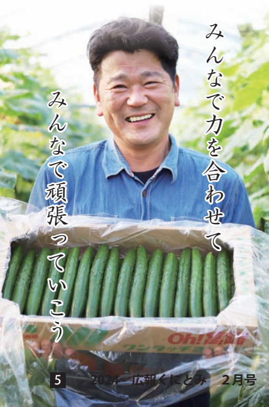
みんなで力を合わせて

J A 宮崎中央国富支店胡瓜部会の部会長や支部長、部会員で構成される胡瓜青年部など、様々な立場で部会を支える皆さんに、部会の魅力や特徴、成長を支える原動力について話を伺いました。