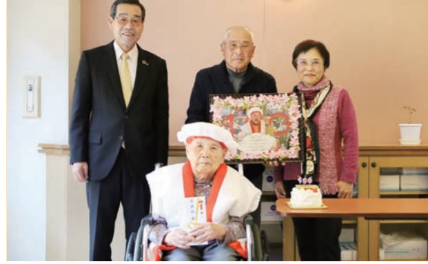
町内には百歳を超えるご長寿が25人います