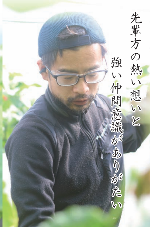
先輩方の熱い想いと