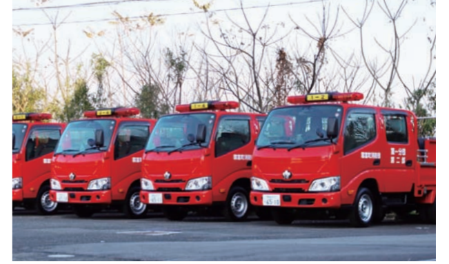
式のあとは、団員たちが現場で活用する装備品を手に取り確認した

12月25日(月)、消防小型動力ポンプ積載車5台を更新し、役場で入魂式を行いました。積載車の更新は令和元年度から開始し今回で全20台の更新が完了。式では、町消防団や地元区長など関係者参列のもと消防防災活動の安全を祈願しました。更新した積載車は車両総重量3.5ト未満でオートマ(AT)車仕様。普通免許で運転することができ、より多くの団員の活用が見込まれます。