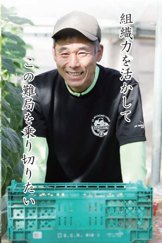
組織力を活かして