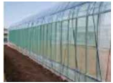
自動かん水タイマー 液肥混入機 天敵製剤 (スワスキーカブリダ) 新防虫ネット