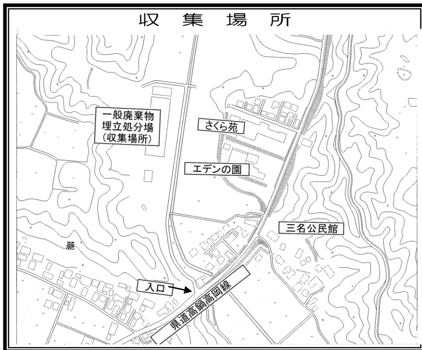
◎三名一般廃棄物埋立処分場