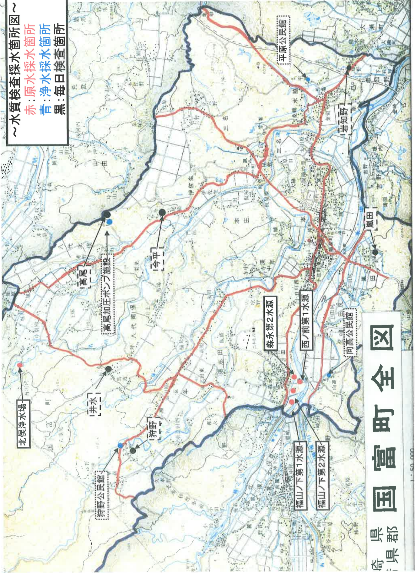
富田郡国富町全図