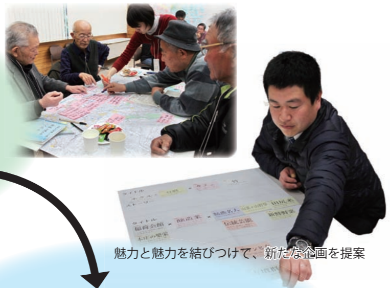
魅力と魅力を結びつけて、新たな企画を提案