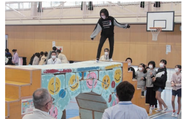
自分達でつくった橋の上を無事に渡り終えると、会場からは歓声が沸き起こりました。

参加した児童は「みんなで協力して橋をつくるのが楽しかったです。つくった橋を実際に歩いてみました。壊れないのがすごかったです」と笑顔で話していました。