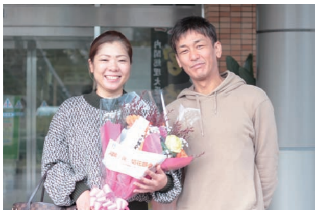
バラやダリアなどの色鮮やかな切花を組み合わせた花束。

同消毒スタンドは、役場玄関窓口のほか、町内の施設などで有効に活用していきます。中別府町長は「心温まる寄贈ありがとうございます」とお礼を述べました。