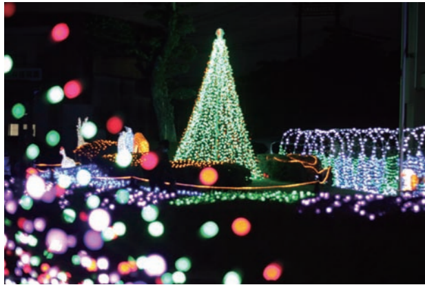
巨大ツリーや長さ約 20 m の光のトンネルが訪れた人を楽しませます。