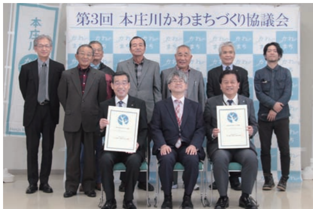
本庄川かわまちづくり協議会委員の皆さん(国富町と綾町合同)

*イルミネーションは、11月13日(土)~翌年1月13日(土)の午後5時30分から9時30分にかけて点灯されます。