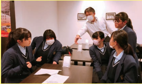
国富製パン所にて、卒業生の笑顔を思い浮かべながら作戦会議

昨年12月28日、本気の者だけが集まる「つどい」を開催しました。4月号の大人を交えた集いとは意味合いの違うものです。やるのか、やらないのか。本気なのか、本気じゃないのか。20数名の未