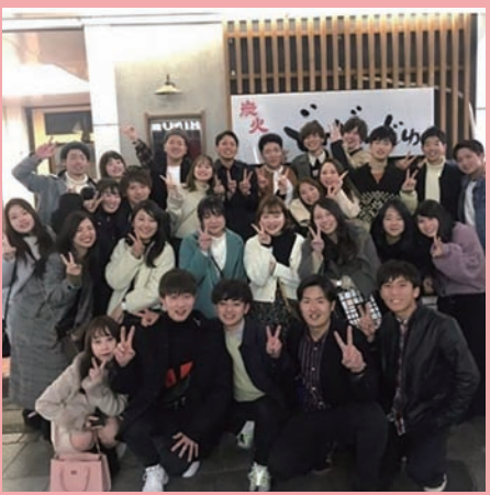
picostgrm_0220 さん 成人式

写真共有アプリ Instagram (インスタグラム) に投稿された写真の中から、国富の魅力発見につながるようなものを、投稿者の了解を得てご紹介！皆さんも国富に関連する写真にハッシュタグ「#国富とme」をつけて投稿してみませんか？