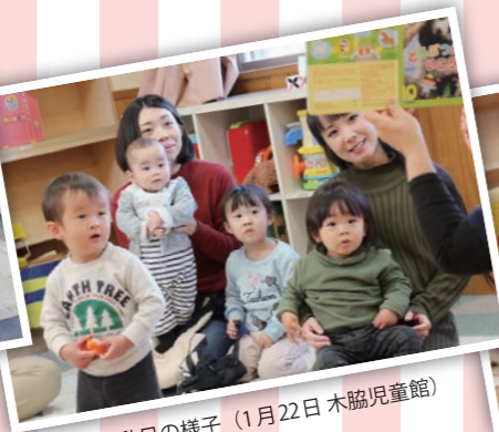
活動日の様子 (1月22日 木協児童館)