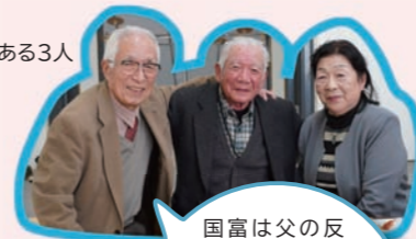
本庄高校の同窓生でもある3人

小学校へは堀内から70分ほどかけて、途中ぬかるんだ道を兄に急かされながら歩きました。来年も同じメンバーで集まれるといいですね。