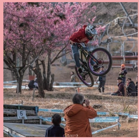
naoki_photo.graphy さん 法華嶽公園ダウンヒルコース

#国富とme でタグ付けされた国富関連の写真は、1月27日の時点でなんと 3,595 件！ これらの写真は、アプリをインストールしていなくても、いつでもどなたでも最新のものをご覧いただけます。 「国富とme」で検索するか、右のQRコードを読み取って、是非国富の「今」をご覧ください！