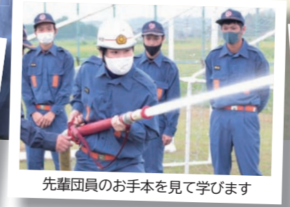
先輩団員のお手本を見て学びます