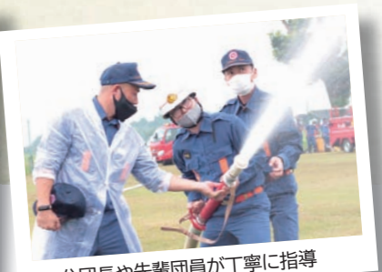
分団長や先輩団員が丁寧に指導