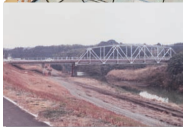
昭和30年代に着工した旧太田原橋