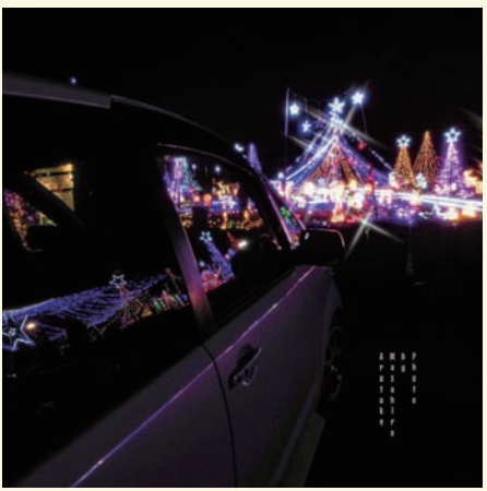
bukko202 さん ピジョン・フラワー

写真共有アプリ Instagram (インスタグラム) に投稿された写真の中から、国富の魅力発見につながるようなものを、投稿者の了解を得てご紹介！皆さんも国富に関連する写真にハッシュタグ「#国富とme」をつけて投稿してみませんか？