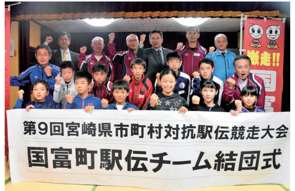
第9回宮崎県市町村対抗駅伝競走大会 国富町駅伝チーム結団式