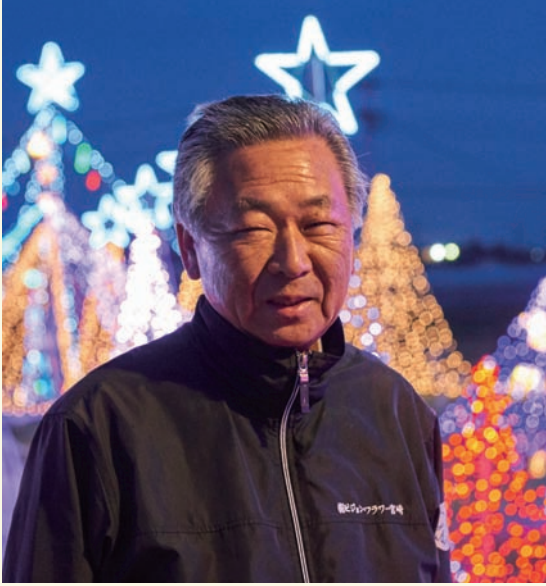
イルミネーションでまちを元気に！ (有)ピジョン・フラワー 代表取締役