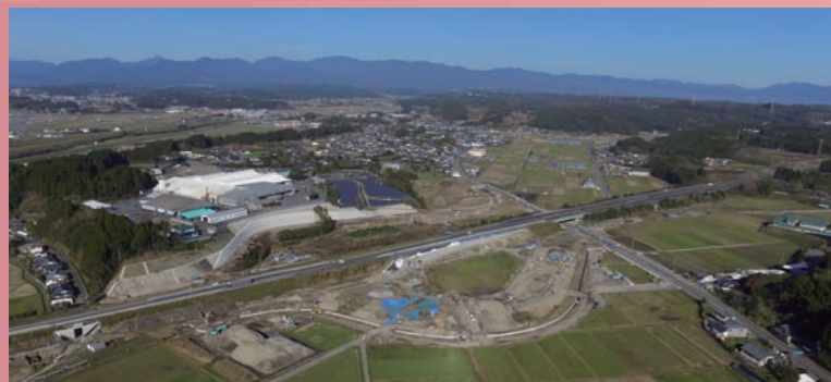
工事が進む国富スマートインターチェンジ(12月19日撮影)

賜りますとともに、議会の傍聴にもお気軽にお願いいたします。新しい年が、町民の皆様にとりまして、健康で幸多き年でありますよう心からご祈念申し上げます。新年のご挨拶いたします。