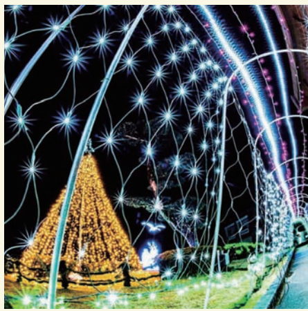
naoki_photo.graphy さん 国富町役場