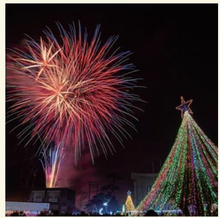
hiroku_photo さん 真冬のたなばた

#国富とme でタグ付けされた国富関連の写真は、12月19日の時点でなんと 3,350 件！ これらの写真は、アプリをインストールしてなくても、いつでもどなたでも最新のものをご覧いただけます。 「国富とme」で検索するか、右のQRコードを読み取って、是非国富の「今」をご覧ください！