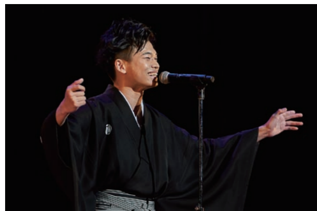
昨年11月の凱旋ライブで熱唱する二見さん