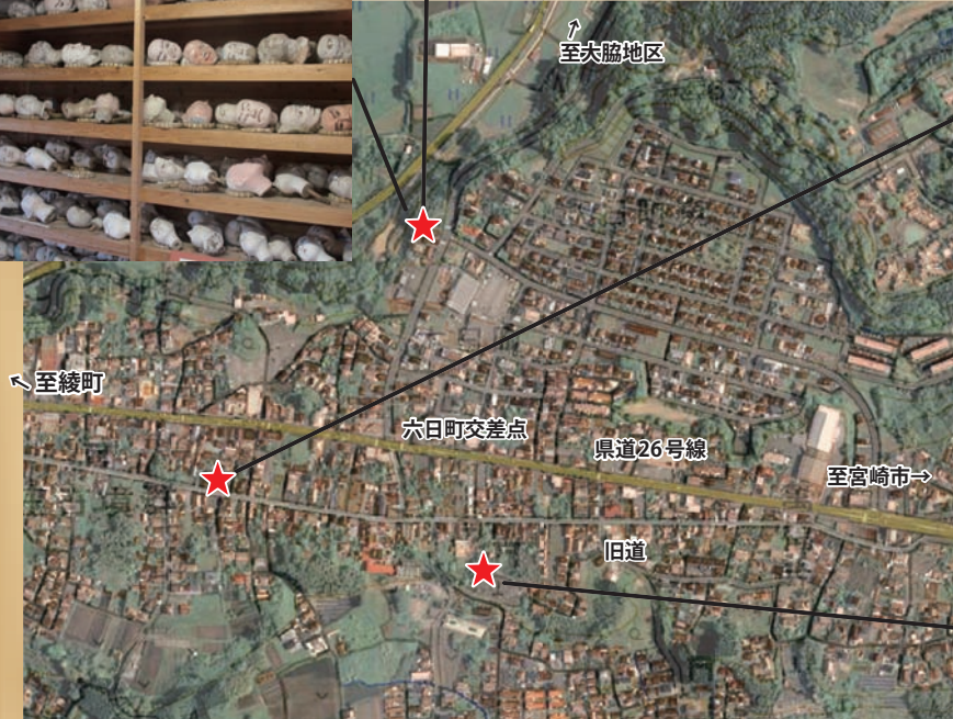
地理院タイルを加工して作成

東西約50メートル高さ約2メートルの円墳。墳丘の上には大将軍神社が建てられています。本庄稲荷神社夏祭りの際、お神輿に乗った神様のお旅所(たびしょ)になります。