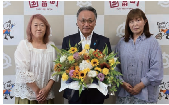
ヒマワリやアジサイなどを使ったアレンジメントフラワー