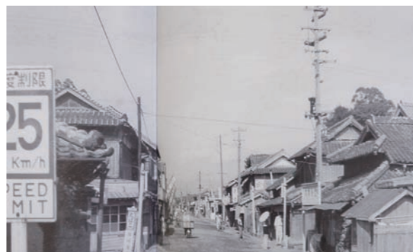
昭和30年頃 六日町地区