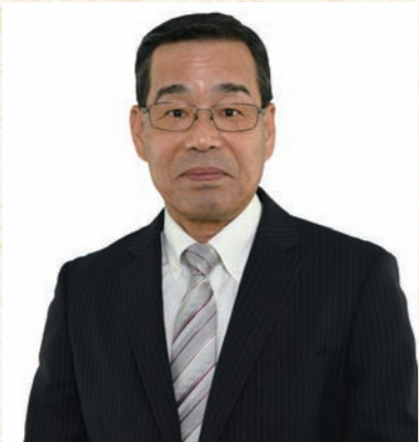
(中別府さんの主な経歴)