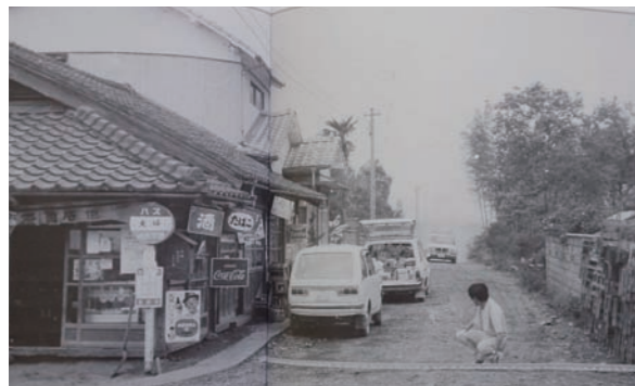
昭和46年頃 大坪交差点