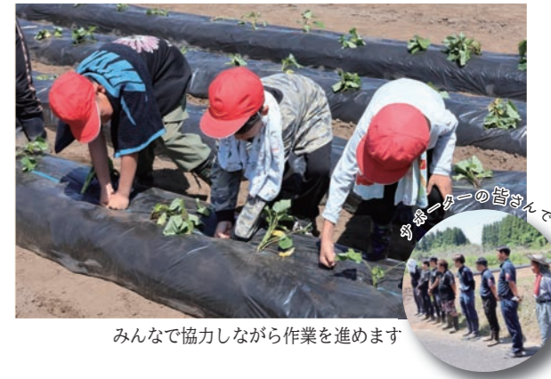
みんなで協力しながら作業を進めます

地域交流のイベントとして5月18日(月)、木脇小学校3年生と農家の方々による芋の苗植え体験が行われました。最初に指導者の方のお手本と説明を聞いたあとに、地域ボランティアの方と一緒に1人10本を目標に苗植えを行いました。参加した生徒たちは「初めての体験で大変だったけど、教えてもらいながら上手くできて楽しかったです」と笑顔で話しました。