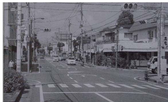
平成22年 六日町交差点

国富町は令和8年、町制施行70周年という大きな節目を迎えます。昭和31年の町制施行以来、本町は豊かな自然環境と先人たちのたゆまぬ努力、そして町民の皆さまの温かな支えによって発展を続けてきました。 この70年の間には、社会や暮らしを取り巻く環境が大きく変化しました。産業や交通網の発展、生活基盤の整備、教育・福祉の充実など、時代のニーズに応えながら、より暮らしやすいまちを目指して歩みを重ねてきました。また、地域に受け継がれてきた伝統や文化、人と人との絆は、今もなお国富町の大きな財産として息づいています。 現在の国富町があるのは、ふるさとを愛し、より良いまちづくりのために力を尽くしてこられた先人の皆さま、そして日々地域を支えてくださる町民の皆さまのおかげです。 人口減少や地域課題への対応など、私たちを取り巻く環境は変化を続けています。しかし、国富町には人を思いやる心や地域を支える力、そして未来を切り拓く可能性があります。先人たちの想いを次の世代へつなぎながら、安全安心なまち「元氣アップ国富」を目指してがんばっていきます。