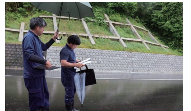
町内で完了した危険箇所工事の説明を行う(都市建設課)

5月26日(火)、町消防団や高岡土木事務所、陸上自衛隊などの関係機関と連携し、町内の災害危険箇所の点検と意見交換会を行いました。点検では、耐震性の向上や決壊防止に向け堤体の工事を進める加藍尾と法面工事が完了した向高地区の現況を視察。それぞれの現場で現状を確認しました。意見交換会では、被害時の情報を迅速に共有することについて協議しました。