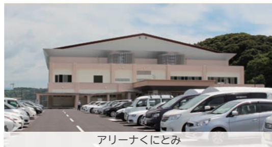
アリーナくにとみ