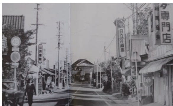
昭和43年頃 十日町東地区