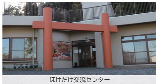
ほけだけ交流センター