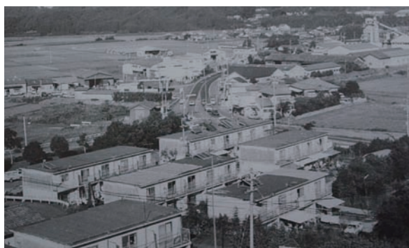
昭和50年代 向陽地区