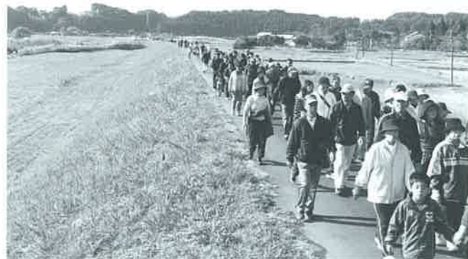
爽やかなウォーキングを楽しむ皆さん

第7回国富町健康ウォーキング大会が11月18日(日)行われ、町内外から参加した405人が爽やかなウォーキングを楽しみました。