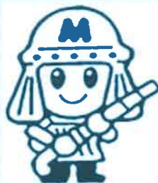
消防団マスコット まもるくん

詳しくは、役場総務課危機管理係、またはお近くの消防団員、各区長さんまでお問い合わせください。