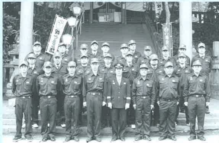
本年の幹部・部長の皆さん