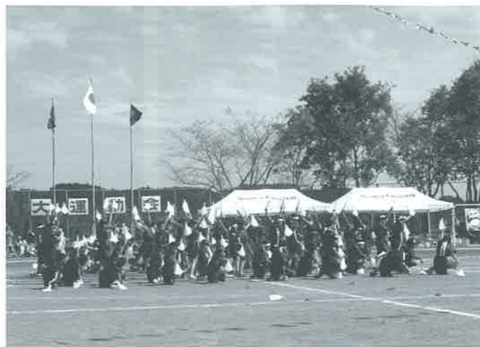
木脇小5年生のみなさん

だいぶ寒くなってきたけど、みんな元気トミ？毎年冬はインフルエンザにかかる人が多いので、うがい手洗いをしっかりしてウィルスを寄せつけないようにしようね！