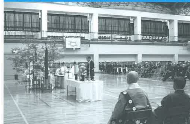
平和への願いを捧げる出席者の皆さん

国富町殉国者慰霊祭が、11月2日(金)に町中央体育館で行われ、出席者全員で黙祷を捧げたあと、祭事(神事・仏事)が執り行われました。