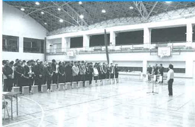
ソフトバレー大会開会式の様子

11月25日(日)、第20回国富町地区対抗ソフトバレーボール大会(国富町バレーボール協会主催)が、町中央体育館で開催されました。今年度から9人制バレーからソフトバレーへ変更して行われました。町内各地区から男女合わせて18チームが参加し、大変な盛り上がりでした。