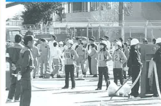
準優勝した国富町役場自衛消防隊(女子チーム)

11月2日(金)、宮崎地区屋内消火栓操法大会が宮崎市の県消防学校で開催されました。