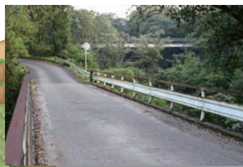
湯の谷橋から地ヶ城橋を臨む