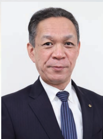
国富町教育長 荒木 幸一

明 けましておめでとうございませす。皆様におかれましては、すがすがしい元旦の朝を迎えられたこととお慶び申し上げます。