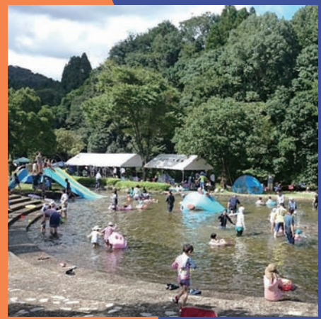
kunitomitomii さん じゃぶんこ広場

#国富とme でタグ付けされた国富関連の写真は、8月27日の時点でなんと 2,582 件！これらの写真は、アプリをインストールすることなく、いつでもどなたでも最新のものをご覧いただけます。「国富とme」で検索するか、右のQRコードを読み取って、是非国富の「今」をご覧ください！