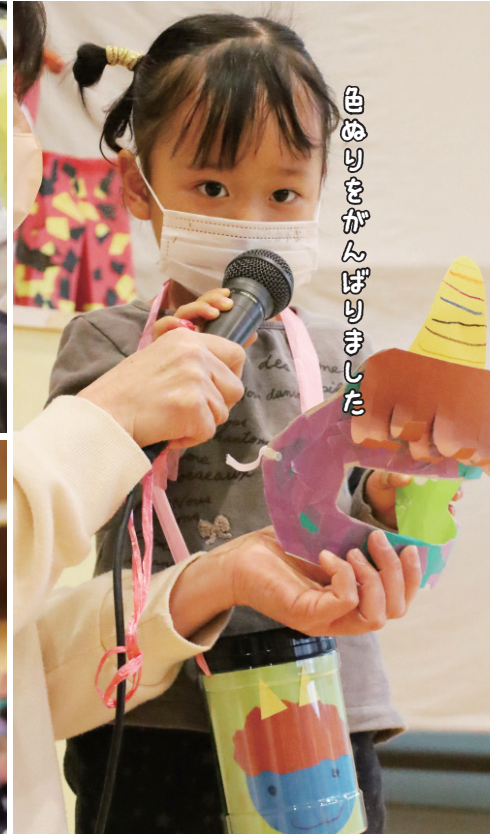
おもしろいゲームをしました