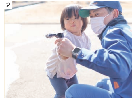
① 積載車の乗車体験で敬礼ポーズ ② 射的コーナー。ペットボトルの的をめがけて水を発射！ ③ 射的コーナーで使用したジェットシューターは実際の消防活動でも活躍しています。 ④ お菓子のつかみ取り。