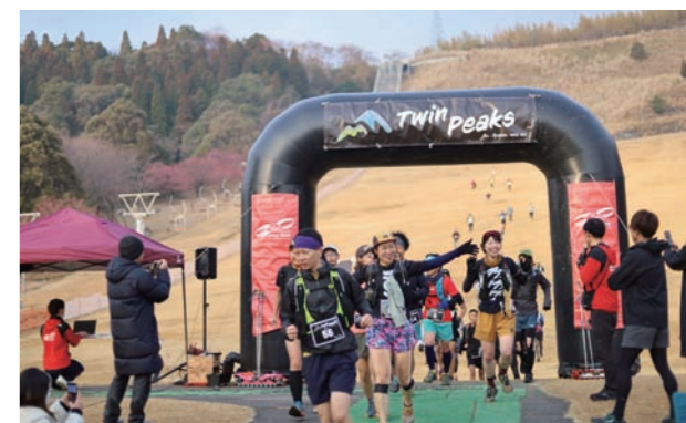
ふるさと納税の返礼品にもなった同大会。県内外から130人が参加しました。

自然の中を走り抜けるアウトドアスポーツ「第2回綾・国富ツインピークス」が2月5日(日)、法華嶽公園グラススキー場を主会場に開催されました。同大会の特徴は、釈迦ヶ岳や綾岳などの登山道約35km、累計標高1900mのロングコース。休憩所では、しらたままんじゅうや地鶏の炭火焼きなどの地元食材が振る舞われるなど、地元ならではのおもてなしでランナーたちを後押ししていました。