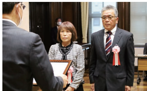
品質管理のほか、栽培技術向上に向けた取り組みなどが高く評価。