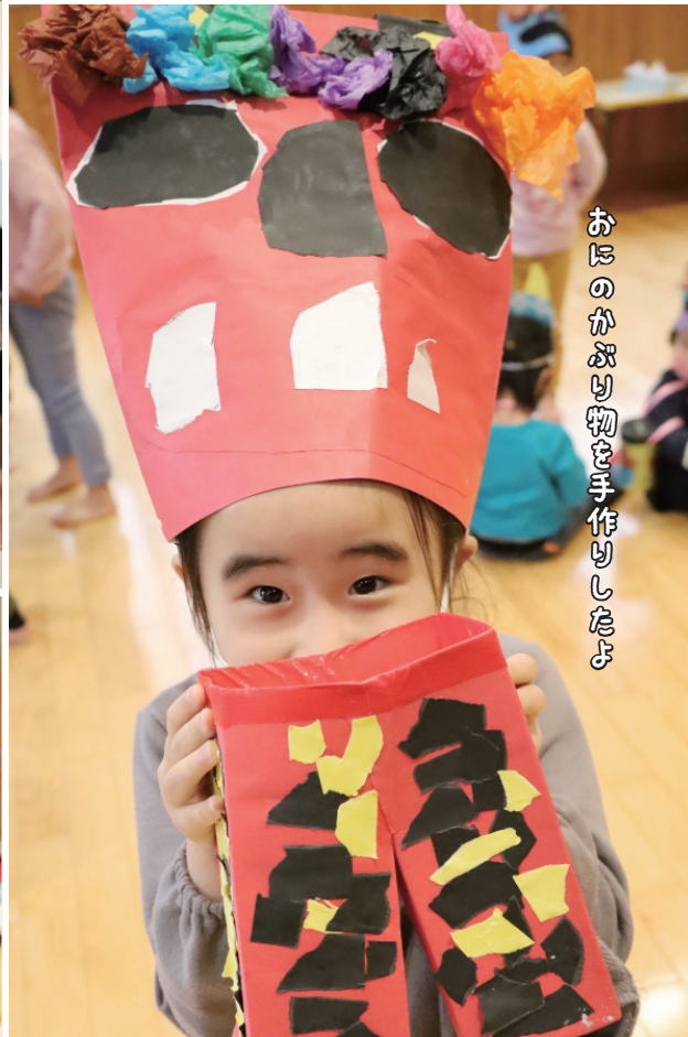
おたのかぶり物を手作りしましたよ