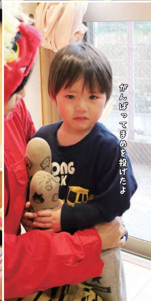
かんぱってきを投げたよ