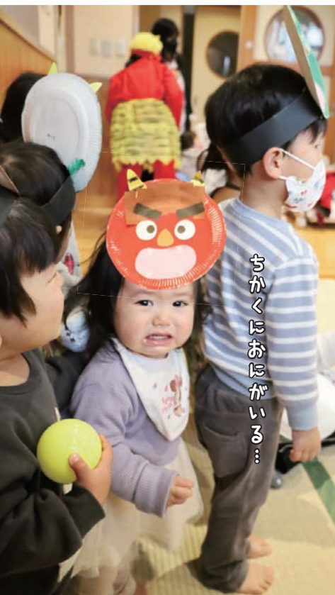
さかくにおたがいる...