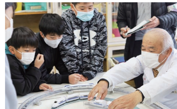
本社[愛知県]からも講師が訪れ、授業をサポートしました。

自動車用の小型モーターなどを製造・販売する㈱デンソー宮崎[平原]の出前講座「デンソーサイエンススクール」が1月23日(月)、木脇小学校で行われました。この日は、同社の社員が講師となり電磁石の性質を説明した後、児童たちは実際に模型を使いながら車のワイパーが動く仕組みやリニアモーターカーの原理を学習。実験主体の授業を通して、理科への関心を高めていました。