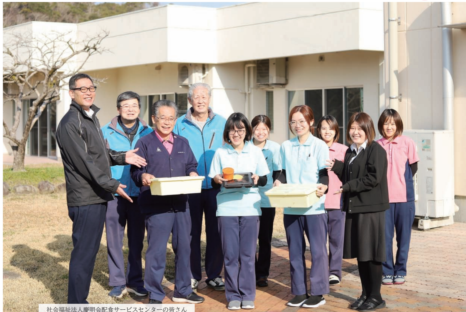
社会福祉法人慶明会配食サービスセンターの皆さん

※概ね70歳以上のひとり暮らしの高齢者や障がい者の皆さんなど、日常生活の支障などから食事の援助を希望する人への配食サービス事業。