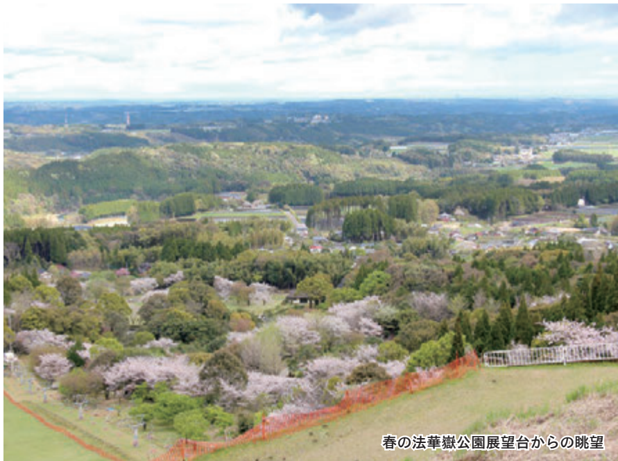
春の法華嶽公園展望台からの眺望