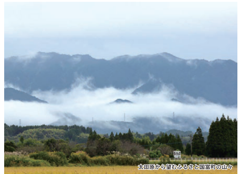
太田原から望むふるさと国富町の山々