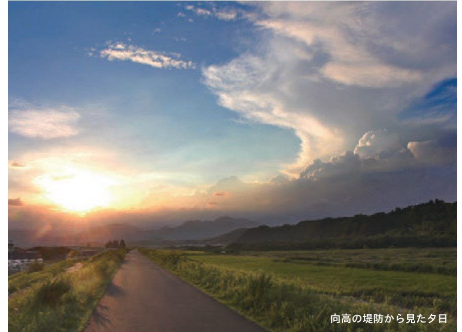
向高の堤防から見た夕日