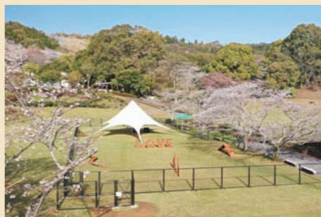
写真映えするドッグラン

法華嶽公園にドッグランが誕生。犬専用の遊具や星型テント、記念撮影が楽しめる設備が充実。