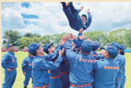
一致団結、国富町消防団

操法要領が大きく変わった年。各部、寸暇を惜しんで朝夕の練習に励んだ成果を披露しました。