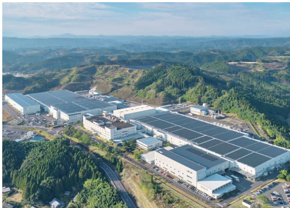
ソーラーフロンティア旧国富工場 [田尻 1815 番地] を取得

ローム㈱は脱炭素社会の実現に向け取り組みを加速している企業。SiCパワー半導体の生産能力拡大を目指しソーラーフロンティア㈱旧国富工場を取得した。新工場を整備し、宮崎市清武町に工場を持つローム㈱グループのラピスセミコンダクタ㈱の宮崎第二工場として稼働予定。生産品目はSiCパワーデバイスとSiCウエハ。就業人数は令和8年度末で約700人を想定。