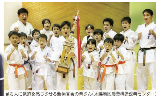
見る人に気迫を感じさせる新極真会の皆さん(木脇地区農業構造改善センター)

自分の限界を越えたくて本気で頑張ってきたから、優勝したときはうれしくて涙が流れた。