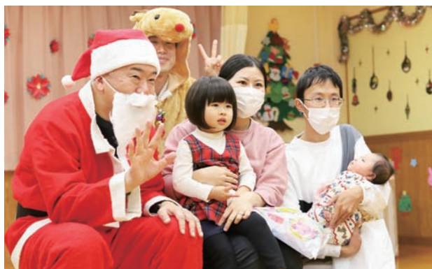
スタッフが心を込めて飾り付けた会場でサンタさんとパシャリ

約1,500発の花火が打ち上がるハナビートフェスティバル(真冬のたなばた実行委員会主催、杉田光実行委員長)が12月16日(土)、役場で開かれました。花火の打ち上げ前には、町内の高校生グループ「Linクニートミ」のダンス披露が行われたほか、訪れた多くの人が多様なグルメを楽しみました。同日、交流プラザくにとみで婚活イベント「恋花火」(同実行委員会主催)が開かれました。