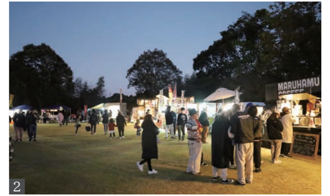
1 HAN-KUN庄巻のステージ。観客をステージ上に招くサプライズや、会場の運営スタッフに向け、感謝の意を込め温かいメッセージを送るなどして盛り上げた2 多様なジャンルの飲食店が多数出店。多くの家族連れでにぎわった。