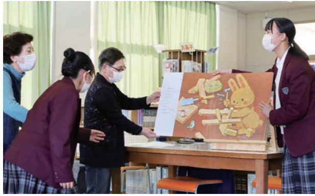
本町の地域ボランティアグループを講師に迎えての開催は初めて