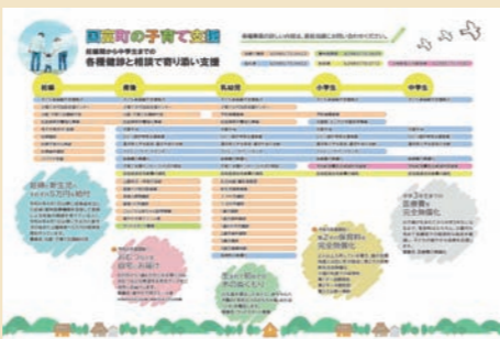
成長段階に合わせたパンフレット

子育て期の負担を軽減するため、3つの新規事業を創設。従来事業と合わせて紹介しています。