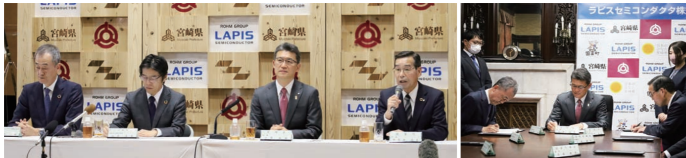
調印式後に行われた記者会見。想定就業人数や投資額、支援の意向などにふれた